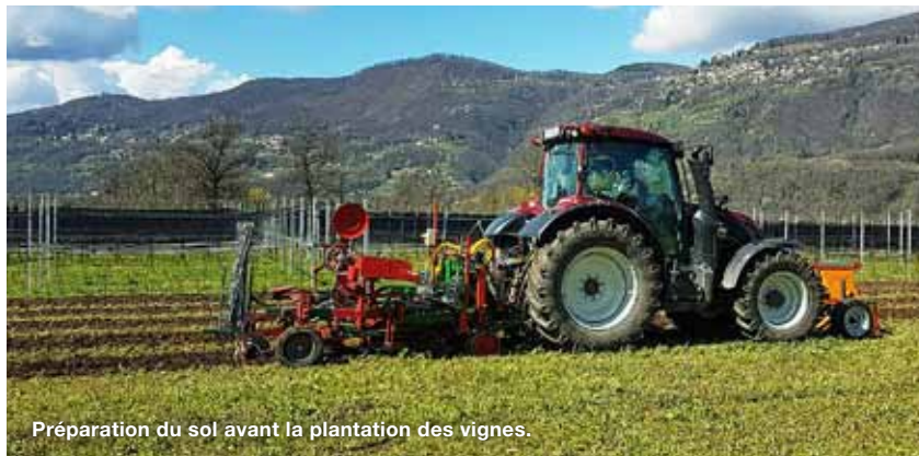
Préparation du sol avant la plantation des vignes.