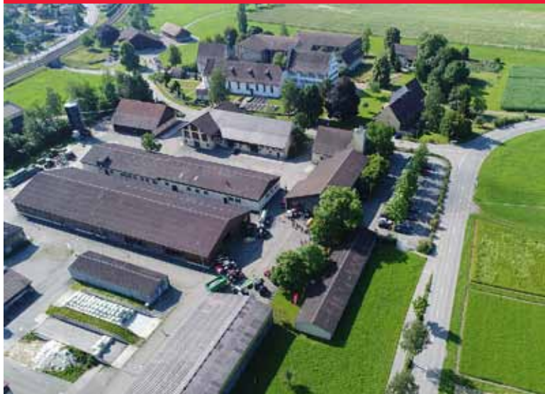
Future Farm à Tänikon, Suisse.

Après chaque étape de travail, et une fois l'ordre de travail exécuté, les données du tracteur sont à nouveau transmises au système FMIS par Task Doc. Le traitement manuel des informations est inutile et le responsable des travaux possède toujours des données actualisées qui peuvent être réutilisées. Car la saison prochaine arrivera vite ! •