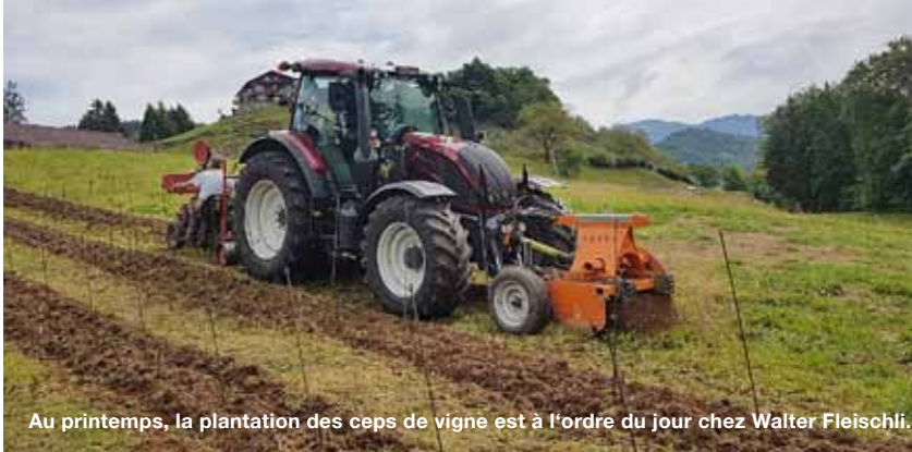
Au printemps, la plantation des ceps de vigne est à l'ordre du jour chez Walter Fleischli.