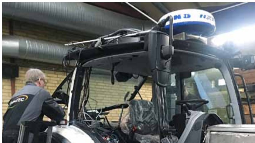
La Valtra N154 est une machine polyvalente pouvant être équipée d'une large gamme d'outils, comprenant un radar maritime, une caméra infrarouge de recherche de chaleur et un projecteur de recherche.

« En plus de leur étanchéité, les tracteurs sont équipés de projec-