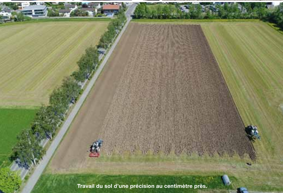
Travail du sol d'une précision au centimètre près.