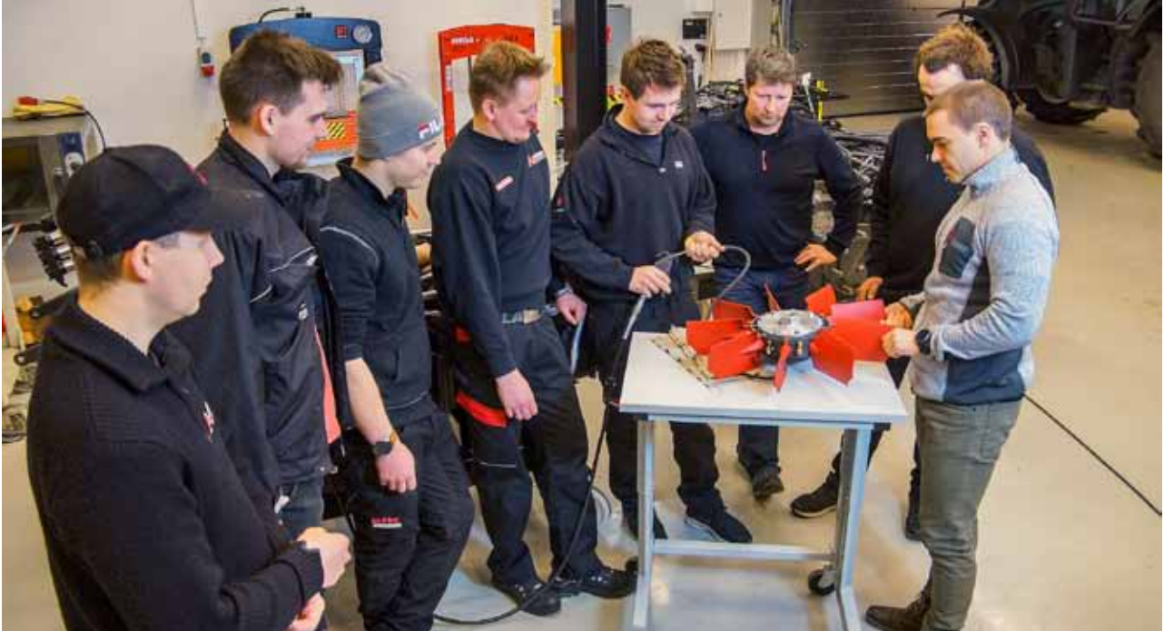
Des monteurs norvégiens dans les nouveaux locaux du centre de formation de Hirvaskangas. La formation professionnelle du réseau d'entretien est une priorité du service après-vente.