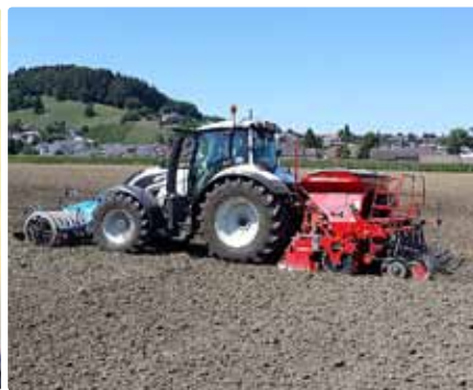
Semis avec Section Control et Variable Rate Control.