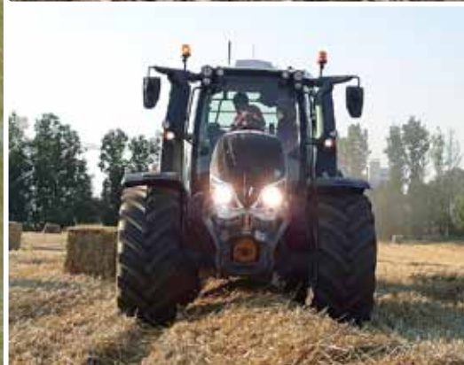
Récolte à la Swiss Future Farm.