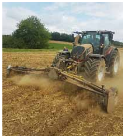
Le broyage des pierres nécessite toute la puissance du Valtra.

Puis, disposant encore de « temps libre » entre les travaux