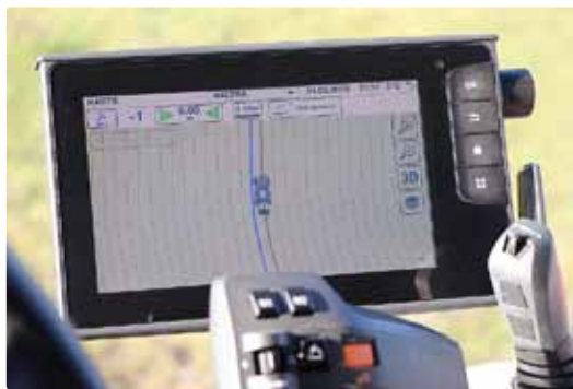
La tâche est transmise au pilote via TaskDoc.