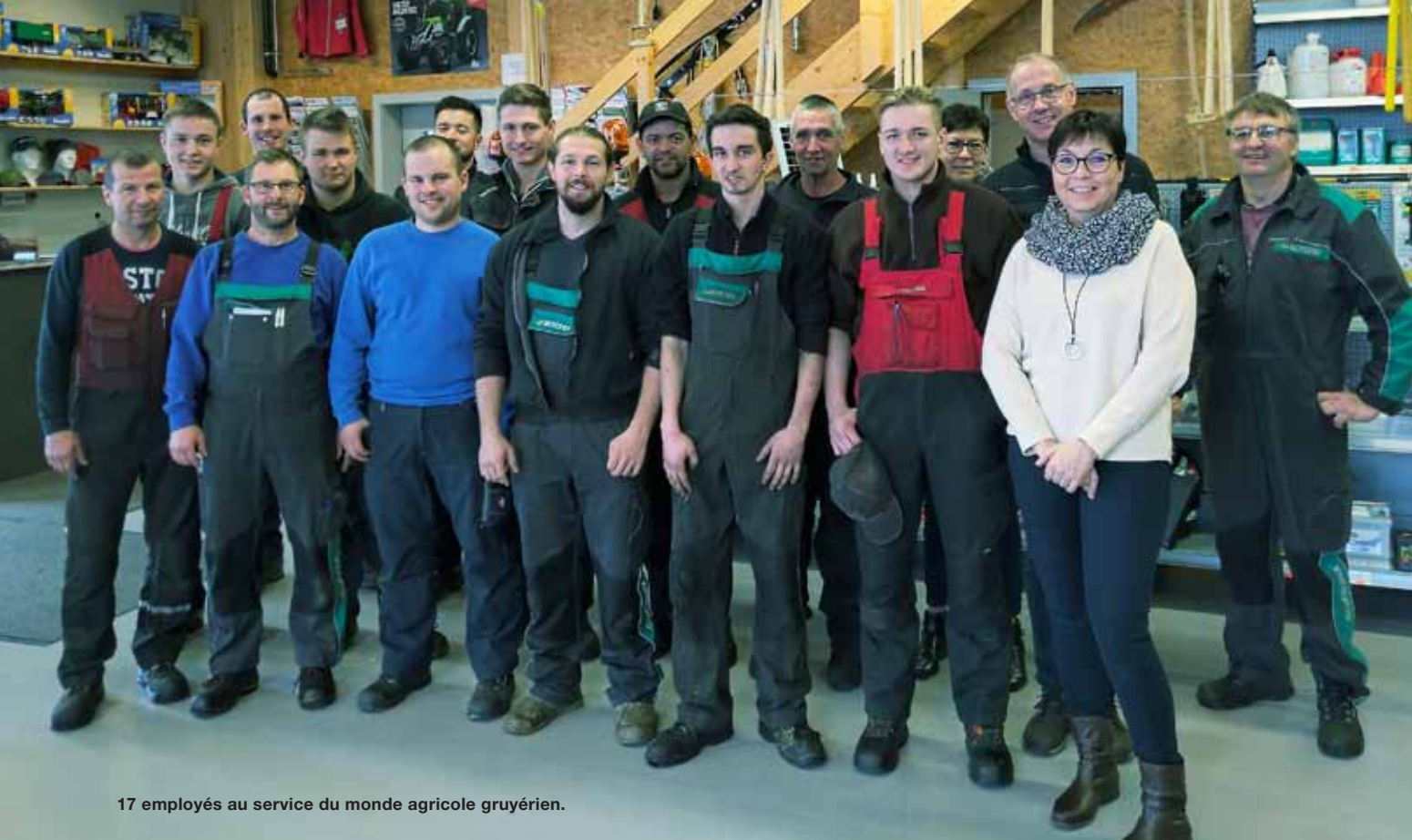
17 employés au service du monde agricole gruyérien.